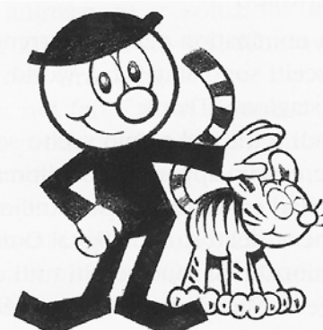
Gustavo Petronio - Arrigo (1930)