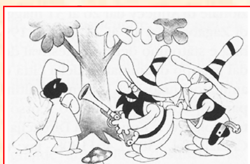
Gibbe e Cassio - Pulcinella nel bosco (1942)

Note di Tecnica Cinematografica , che lo ebbe a lungo attivo e disinteressato collaboratore, coglie l'occasione per porgere un caldo e affettuoso saluto ringraziando il tecnico, il collaboratore e l'amico.