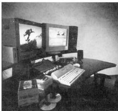
Media 100 QX NT MAC

I sistemi Finish e Media 100 sono compatibili grazie ad un trasduttore software che permette a Finish di riconoscere e gestire i progetti realizzati con Media 100 4.5 (vedi sito Internet HYPERLINK http://www.media100.com ).